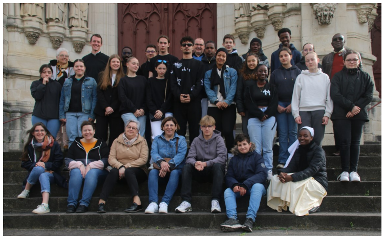
Retraite des confirmands à Châteauneuf sur Cher