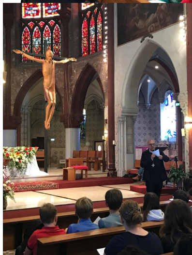
Rassemblement diocésain de 6èmes et 5èmes à Issoudun