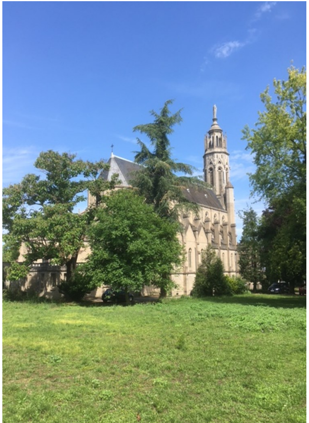
Église Sainte Barbe, vue du parc