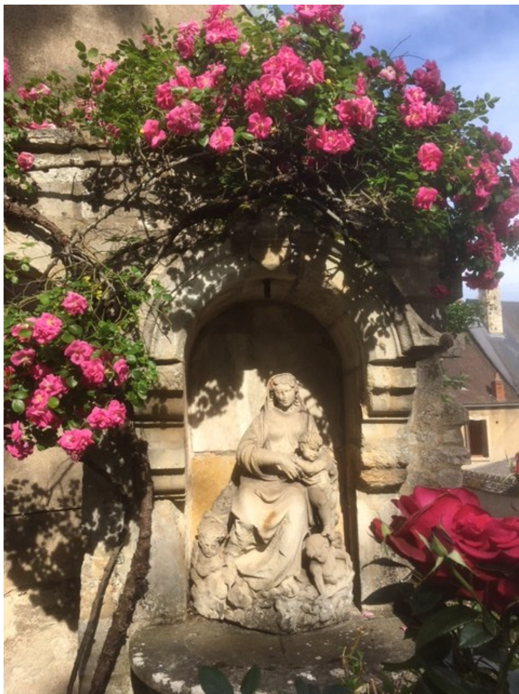
Vierge à l'Enfant - Jardin du presbytère de la Cathédrale