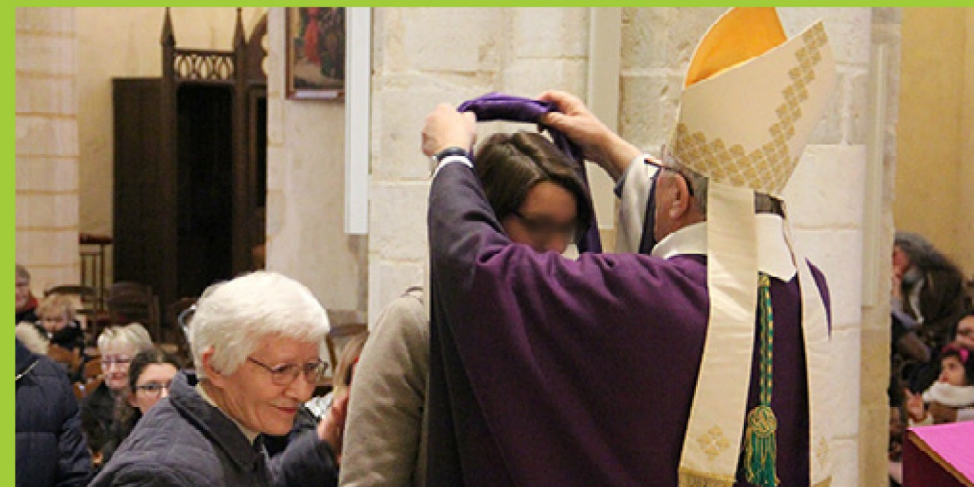
église de Saint-Amand-Montrond - 18 février 2018

Dimanche 18 février dernier, les catéchumènes du diocèse étaient appelés par l'évêque, Mgr Maillard, au cours d'une célébration à Saint-Amand-Montrond. Cet appel est charnière puisqu'il marque la dernière ligne droite avant leur baptême.