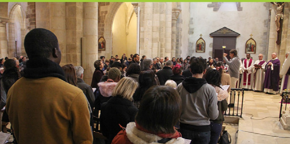
L'appel décisif des catéchumènes à Saint-Amand-Montrond - 18 février 2018