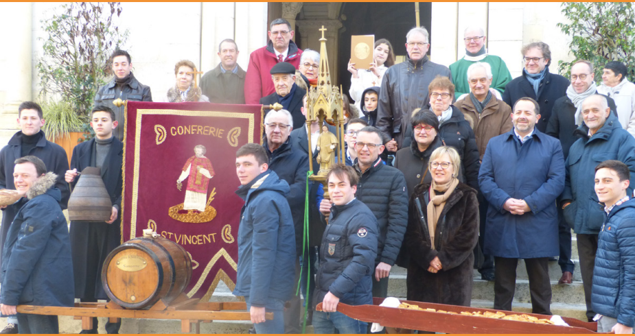
Fête de la saint Vincent à Sancerre