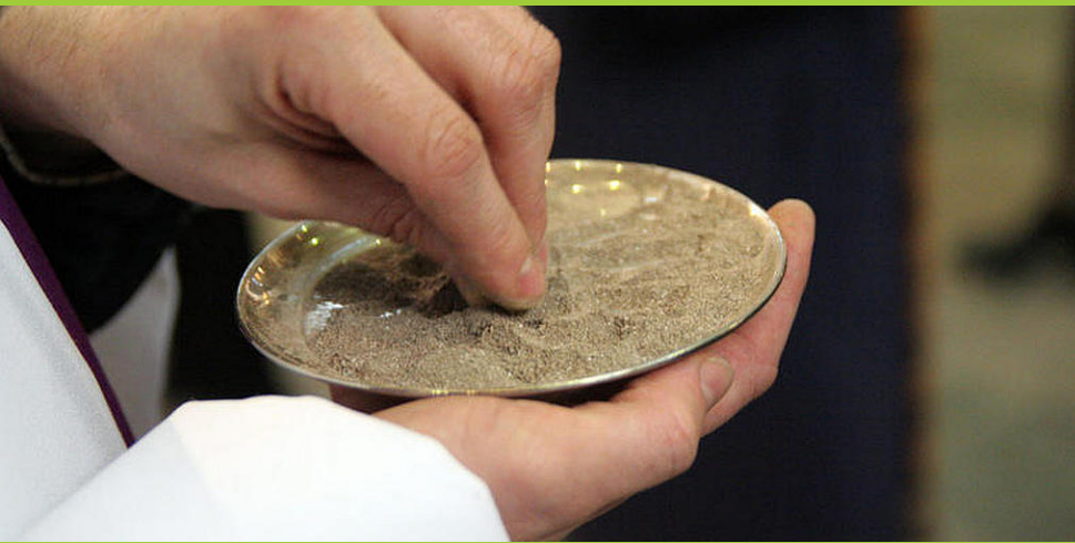
Au cours de la célébration des cendres