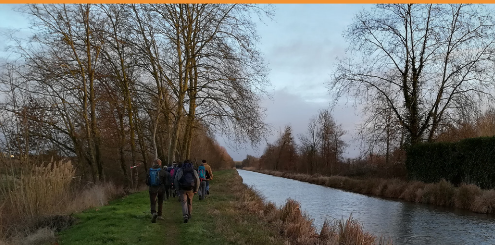
Dimanche matin : marche entre Plaimpied et Bourges - canal du Berry

« Voici la servante du Seigneur, qu'il me soit fait selon ta Parole »