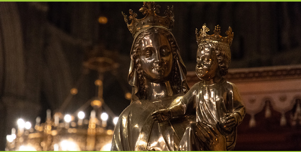
Vierge Marie et l'enfant Jésus, couronnés - cathédrale de Bourges