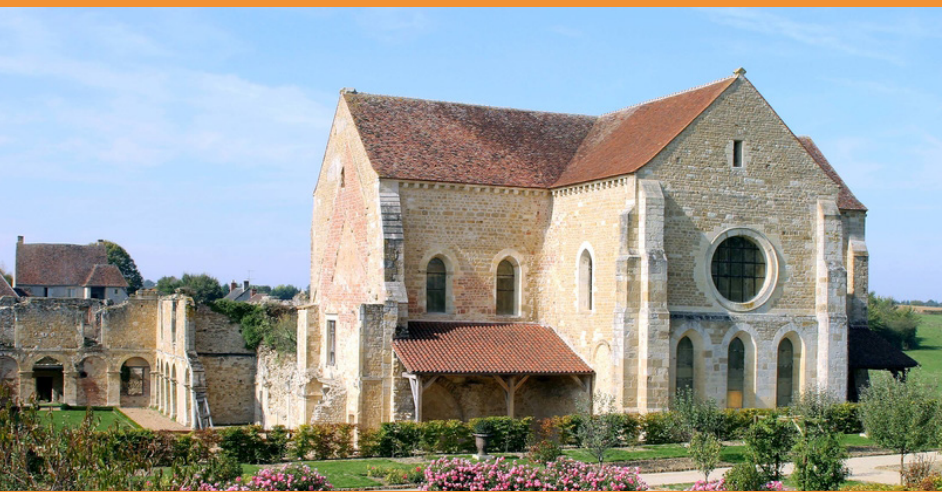
Abbaye de Fontmorigny