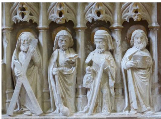
Devant d'autel - église de Jussy-Champagne

« Dans l'histoire de l'humanité, depuis que l'homme sait qu'il est homme, et bien avant que d'écrire, il a exprimé sa pensée intérieure, la conscience de soi, sa relation à l'autre et sa perception de sa transcendance par un geste plastique, musical, architectural, chorégraphique ou poétique. » Emmanuel Audat (article page 2)