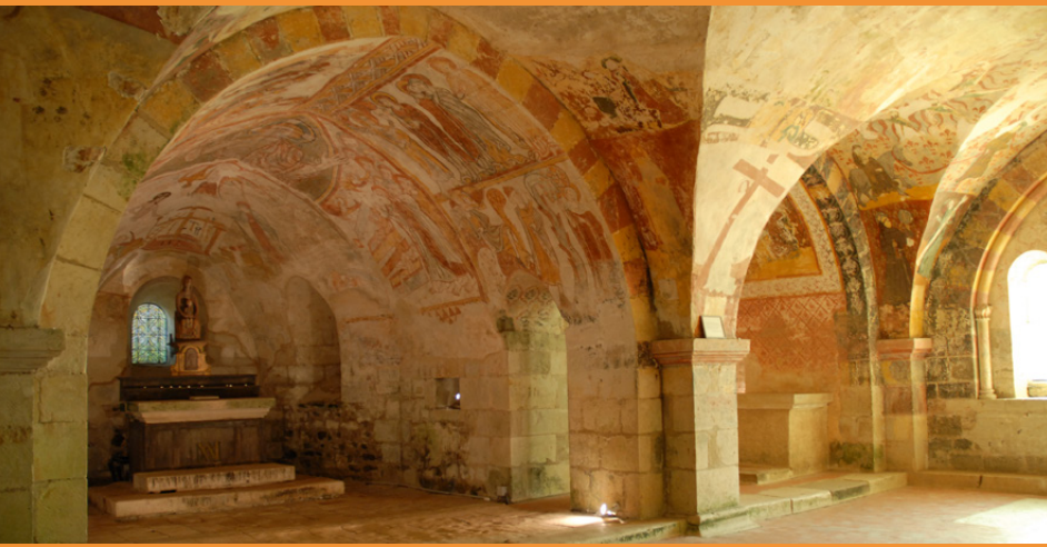
Notre-Dame de Gargillesse