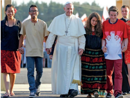
Regarder un monde en train de naître.

Nous sommes TOUS appelés à la mission. Tout comme les disciples de Jésus, qui sont devenus ses apôtres après sa Résurrection. Nous ne pouvons cependant pas mener cette mission sans l'aide des autres, sans le soutien d'une communauté chrétienne. Cela doit être le désir de chaque chrétien, conformément à l'appel de Jésus, que de voir l'Église devenir un cœur nouveau pour regarder notre monde nouveau qui est en train de naître. (article page 2)