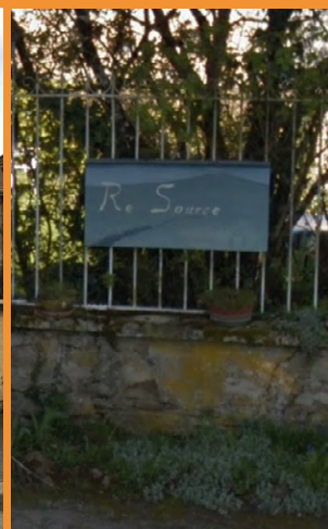
Le nouveau Centre Re-source à Sainte Sévère et l'ancien panonceau