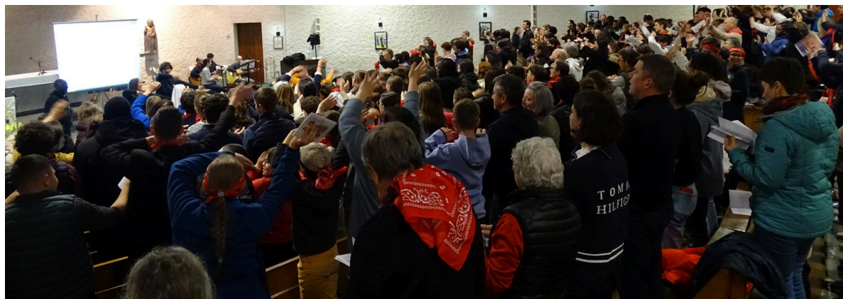
Arrivée dans la basilique Saint-Pie-X pour la messe internationale

Après une journée de route, célébration d'accueil dans la chapelle Saint-Joseph