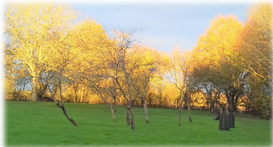
Aurore sur les vergers du Berry

Nous avons vécu cet itinéraire pour vivre le Triduum pascal de pièce en pièce, qu'avons-nous retenu ? Qu'avons-nous apprécié ? Quel moment nous a plus particulièrement marqués ?