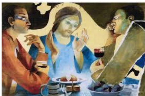
Arcabas, les pèlerins d'Emmaüs

Tous les dimanches, le Christ vous invite à partager une communion fraternelle dans votre paroisse.