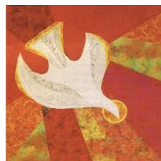
Arcabas, la Pentecôte

Tous les dimanches, le Christ vous invite à partager une communion fraternelle dans votre paroisse.