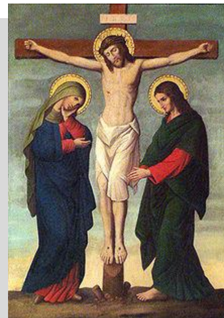
Stabat Mater, xixe, Porto Alegre, Brésil.

Je vous salue, Marie, pleine de grâce, Le Seigneur est avec vous, Vous êtes bénie entre toutes les femmes, Et Jésus le fruit de vos entrailles est béni. Sainte Marie, Mère de Dieu, priez pour nous pauvres pécheurs, Maintenant et à l'heure de notre mort. Amen