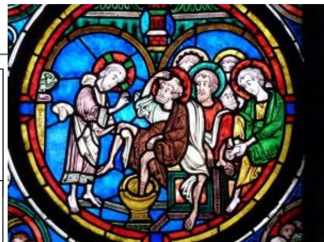
Vitrail du lavement des pieds- Cathédrale St Etienne- Bourges

Avançons-nous donc avec assurance vers le Trône de la grâce, pour obtenir miséricorde et recevoir, en temps voulu, la grâce de son secours.