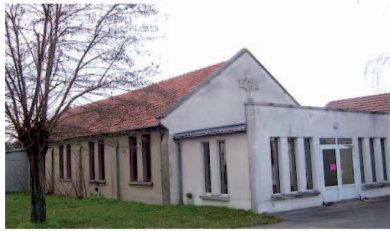
Notre-Dame de la Paix