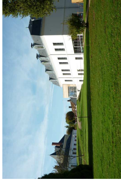
Sanctuaire de Pellevoisin